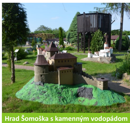
Hrad Šomoška s kamenným vodopádom

V našej expozícii máme viacero veľikánov, od roku 2010 zívajú prázdnotou podložka pod Bratislavský hrad. Keďže je situovaná priamo pri vstupe do našej expozície, návštevníci sa často pýtali, čo tam bude. Pri získaní dotácie z Ministerstva kultúry SR sme neboli úspešní, minulý rok sa naskytla výnimočná príležitosť v súvislosti s predsedníctvom SR v EÚ a ľady sa pohli. Na jar 2016 nám ponúkol pomoc rodák z Podolia. Poskytol nám potrebnú výkresovú dokumentáciu a pomohol získať viaceré doplnkové podklady. Viackrát sme osobne navštívili hrad, aby sme si detaily zamerali, nafotili. Naši partneri a sponzori čiastočne prispeli na materiál a stavbu. Vzhľadom na rozsiahly objekt, ktorý si vyžaduje veľa práce, si nie sme istý, kedy ho dokončíme. Dúfame a všetko robíme preto, aby sme Vám ho predstavili v plnej krásne už počas sezóny 2017.