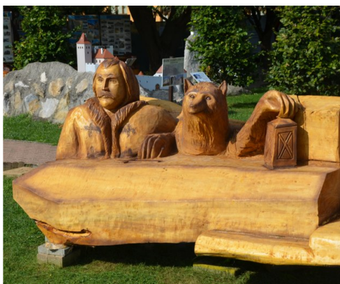
Drevená plastika "Spišské tajomstvo"

Ako rastie návštevnosť, stále väčší tlak je na oddychový priestor a posedenie v parku. Moderné detské ihrisko zatiaľ nemáme, celkom prijateľne ich zatiaľ zastupia naše feudálne disciplíny. Od roku 2015 sme začali skrášľovať tento priestor, pribudli prvé drevorezby Múdra sova a drak. Hlavne počas sezóny školských zájazdov a zájazdov dôchodcov sú skutočne využité naplno. Sú priam ideálnym miestom na spoločnú fotografiu.