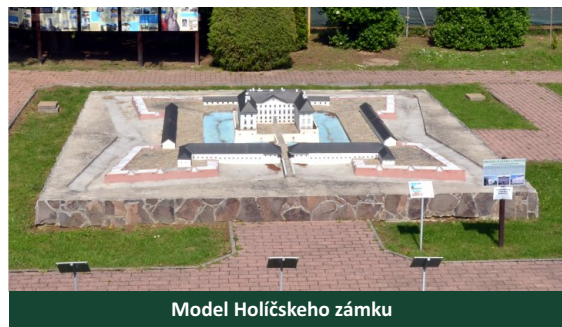
Model Holíčskeho zámku

Prezentovali sme Park miniatúr vo viacerých médiách, v reláciách na STV, TV Markíza, či TV JOJ, článkoch vo viacerých denníkoch. Celá sezóna 2016 by však nebola taká pestrá bez našich spolupracovníkov, ktorí nám pomáhajú rozširovať expozíciu, budovať a vylepšovať naše modely, skrášľovať areál, skvalitňovať naše služby a rozširovať naše podujatia. Modely by nepribúdali tak rýchlo, nebyť podpory našich partnerov. K materiálu, ktorý získame od sponzorov pridáme kvalifikovanú prácu našich modelárov. Návštevníkom a verejnosti sa snažíme čo najviac priblížiť históriu a unikátnosť areálu, prezentovať naše spoločné úsilie. Ďakujeme všetkým za podporu a pomoc, cenné pripomienky, nápady aj kritiku, ktoré nám pomáhajú nestále sa zlepšovať.