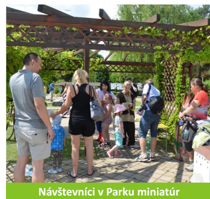
Návštevníci v Parku miniatúr