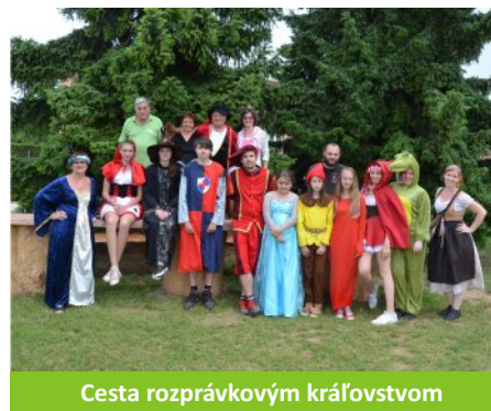
Cesta rozprávkovým kráľovstvom

Počas letnej sezóny sme už druhý rok pripravili súťaž pre návštevníkov všetkých vekových kategórií pod názvom Letná pátračka v Parku miniatúr. Dvanásť otázok o modeloch, histórii, náučných paneloch preverilo ich pozorovací talent a vedomosti. Z celkového počtu 680 úspešných uchádzačov sme vyžrebovali po 20 výhercov na začiatku augusta a septembra, v novembri ešte 10 výhercov hlavných cien. Tešíme sa pozitívnej odozve od návštevníkov, ktorí sa zapojili a veríme, že si tak spestrili prehliadku a potešili ich vecné výhry.