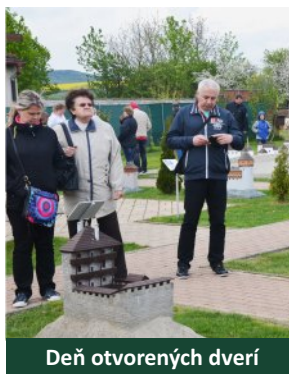
Deň otvorených dverí

Každoročne organizujeme naše tradičné akcie. Na konci apríla Dňa otvorených dverí na Juraja, Cesta rozprávkovým kráľovstvom na Deň detí, Nočná prehliadka spolu s doplnkovým programom okolo 10. augusta, hudobný koncert uprostred leta a stále plánovaný vianočný program počas adventu , to je len zopár akcií z nášho kalendára. Máj a jún sú tradične doménou školských zájazdov, júl a august patrí širokej verejnosti a letným táborom. Krásny a teplý september priláka vždy veľké množstvo návštevníkov.