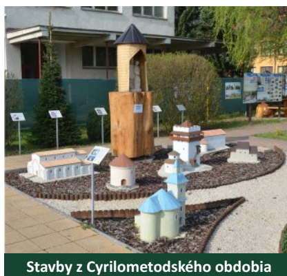
Stavby z Cyrilometodského obdobia