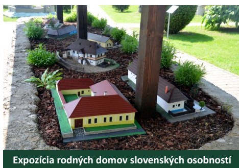
Expozícia rodných domov slovenských osobností

V roku 2017 sme návštevníkom pripravili jedinečnú novinku – novú expozíciu venovanú Rodným domom významných slovenských osobností. Počas Veľkej noci sme verejnosti slávnostne predstavili – prvé štyri modely P.O. Hviezdoslava, P. Dobšinského, J. Krónera a M. Kukučina. Postupne sme novú expozíciu pod prístreškom doplnili rodným domom J. C Hronského, Ľ. Štúra a A. Dubčeka, J. Ľ. Holubyho a M. R. Štefánika. Kto by nepoznal Hájnikovu ženu, Statky zmätky, Budkáčika a Dubkáčika, Rysavú jalovicu, Sváka Ragana, či úsilie buditeľov slovenského národa. Všetci títo naši veľikáni sa narodili väčšinou v skromných podmienkach a modely rodných domčekov sú naozaj malebné. Nová expozícia oslovila návštevníkov všetkých vekových kategórií. Na peknom mieste, v kúte pod vrbami, sa vynímajú pod prístreškom medzi našimi prvými dvoma modelmi, hradom Branč a Holíč.